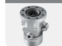
with integrated valve Code F17163000