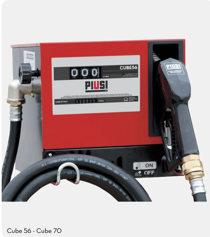
Cube 56 - Cube 70