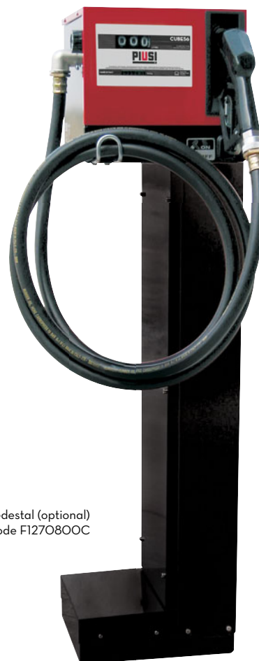
Pedestal (optional) Code F1270800C